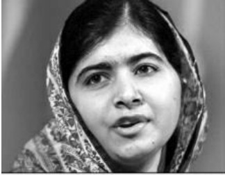
नोबेल पुरस्कार जाहीर झाल्यानंतर प्रतिक्रिया देताना

युरोपियन संघाच्या संसदेनं ‘सॅकॅरोव्ह मानवाधिकार’ पुरस्कारासाठी मलालाची निवड केली. “अल्पवयीन मलाला ही एक आदर्श मानवाधिकार कार्यकर्ती आहे. तिच्या धैर्याचा गौरव म्हणून आम्ही हा सन्मान तिला देत आहोत. तिच्या उज्वल भविष्यासाठी आमच्या खूप खूप शुभेच्छा आहेत.” पुरस्कार समितीनं तिच्याबद्दल उद्गार काढले. याच सुमारास शांततेच्या नोबेल पुरस्कारासाठी मलालाचं नामांकन झाल्याची बातमी आली. यावर मलाला नम्रपणे म्हणाली, “शांततेच्या नोबेल पुरस्काराचे खरे मानकरी असलेल्या अनेक व्यक्ती या जगात वेगवेगळ्या क्षेत्रात काम करत आहेत. त्यांचं कर्तृत्व महान आहे. अगोदर त्यांना हा पुरस्कार मिळावयास हवा. त्यांच्यासमोर माझे काम काहीच नसल्यानं या पुरस्कारासाठी मी अजिबात पात्र नाही. मी नुकतेच कामाला सुरुवात केली असून अजून बराच दूरचा पल्ला गाठावयाचा आहे.”