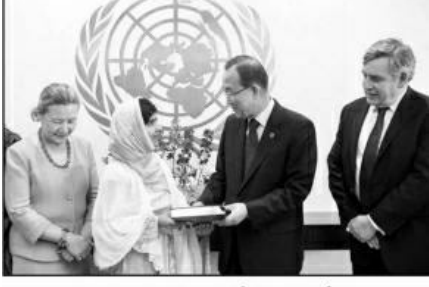
संयुक्त राष्ट्रसंघात बान-की-मून यांच्यासोबत

“मलाला बेटी, तू आता एकटी नाहीस. आम्ही सगळे तुझ्यासोबत आहोत, नव्हे तुझ्या पाठीमागं उभे आहोत.”