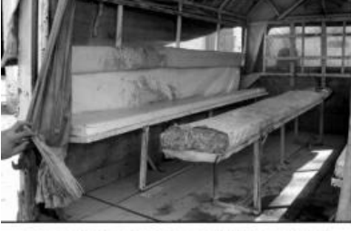
या स्कूलबसमध्ये बसलेल्या मलालावर गोळी झाडण्यात आली