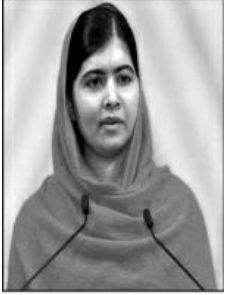
भाषण करताना मलाला

“बिस्मिल्लाहिर्रहमानिर्रहीम” सर्वशक्तिमान आणि दयाळू परमेश्वर श्रीमंत राजे साहेब, नोबेल समितीचे नॉर्वेतील मान्यवर सदस्य, प्रिय भगिनी आणि बंधून्तो! आजचा माझ्यासाठी आनंदाचा दिवस आहे. नोबेल समितीनं माझी या प्रतिष्ठेच्या पुरस्कारासाठी निवड केली, याबद्दल मी नम्रपणे आपले आभार मानते.