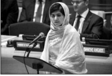
सोळाव्या वाढदिवशी संयुक्त राष्ट्रसंघात भाषण करताना

प्रिय बंधू आणि भगिनींनो युनोनं आज मलाला दिवस साजरा करण्याचं ठरविलं आहे, कृपया आपण एक गोष्ट ध्यानात ठेवा. हा मलाला दिवस माझा नाही.