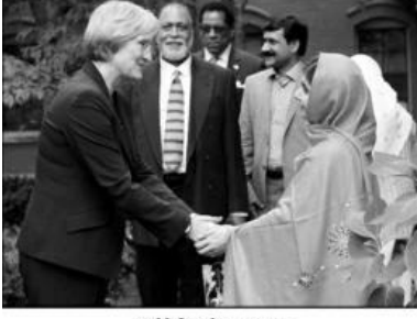
हॉवर्ड विद्यापीठात मलाला

पाकिस्ताननं 2011 चा आंतरराष्ट्रीय मुलांसाठीचा शांततेचा पुरस्कार मलालाला जाहीर केला. यावेळी तिने शांतता आणि बालकांच्या शिक्षणाचा हक्क हिरावून घेऊ नका, अशी सरकारला विनंती केली होती. ती म्हणाली, “शिक्षण हीच प्रगती आणि परिवर्तनाची गुरुकिल्ली आहे. मुलींच्या शाळा दहशतवादी बंद करतात, मोडतोड करतात. त्यांना मला एकच सांगायचं आहे. तुमची मुलगी, तुमच्या बहिणीला तुम्ही शिकवणार आहात की नाही?”