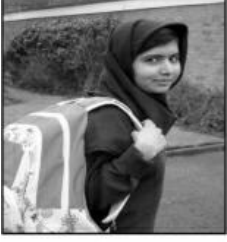
शाळेत जाताना मलाला

फझलुल्लाहाचे सहायक मौलाना शाहदुरान यांनी रेडिओवर फर्मान काढलं, “मुलींच्या सगळ्या शाळा बंद करा. येत्या पंधरा तारखेची मुदत आहे. नियम न पाळणाऱ्यांना शिक्षा केली जाईल.” रेडिओवरची धमकी ऐकून झियाउद्दीनला चिंता वाटू लागली. दिवसेंदिवस परिस्थिती हाताबाहेर जाऊ लागली होती आणि नवं सरकार याकडे गांभीर्यानं बघत नव्हतं, हे त्यांचं दुःख होतं.