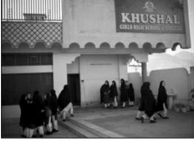
'खुशल पब्लिक स्कूल' मध्ये जाणाऱ्या विद्यार्थिनी

दृष्टिकोन उदारमतवादी होता. स्वात खोऱ्यात होणाऱ्या दहशतवाद्यांच्या अत्याचाराबद्दलही ते नाराज होते. पाकिस्तानात मुस्लिमात अनेक जाती-उपजाती होत्या. त्यांचे आपसांत झगडे सुरू होते. स्वार्थासाठी नातेसंबंध तोडून एक दुसऱ्याच्या जीवावर काहीजण उठत होते. गेली अनेक वर्षे ही भांडणं-तंटे सुरू आहेत. स्वातच्या खोऱ्यातही मुस्लिमांच्या अनेक जमाती आहेत. त्याही वेगवेगळ्या कारणांनी आपापले वैर भांडणातून व्यक्त करत असतात. अशा वातावरणात गावा-गावातील भांडणं मिटावीत म्हणून जिरगा नावाची संस्था काम करी. झियाउद्दीन यांची या संस्थेत महत्त्वाची भूमिका असे. आपापसात भांडून शत्रूंना मदत करू नका, असे ते या मंडळींना समजावून सांगत. त्यांचं हे काम काही लोकांना आवडत नसे. त्याकाळात गावोगाव काही मंडळी स्वतःला मुफ्ती समजत.