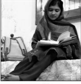
वाचण्यात रमलेली मलाला

आपल्यावर चालून आली आहेत. आमचं ऐकलं नाही तर, याहूनही भीषण संकटाला सामोरं जावं लागेल, अशा धमक्याही वाढत होत्या.