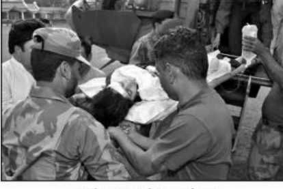
जखमी मलालाला पेशावरला नेताना

पेशावरच्या सैनिकी हॉस्पिटलमध्ये उपचारासाठी नेण्याची व्यवस्था करत आहोत. आपण काळजी करू नका.” मुख्यमंत्री फोनवर बोलत होते. पुढे ते म्हणाले, “आम्ही तुमच्यासोबत आहोत.”