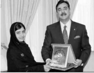
पाकिस्तान सरकारचा पहिला राष्ट्रीय ‘युवा शांतता पुरस्कार’

हा पहिला राष्ट्रीय पुरस्कार स्वीकारताना मलाला म्हणाली, “मी कोणत्याही राजकीय पक्षाची बांधिलकी