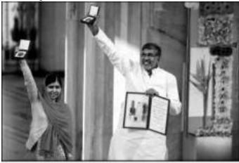
नोबेल पारितोषिक स्वीकारण्यानंतर मलाला व भारताचे कॅलाश सन्मार्थी

आज अर्ध्या जगात जलद प्रगती, आधुनिकीकरण दिसते. त्याचबरोबर अशी अनेक देश आहेत जेथे उपासमार, गरिबी, अन्याय आणि संघर्षांच्या जीवनां होरपळून जात आहेत.