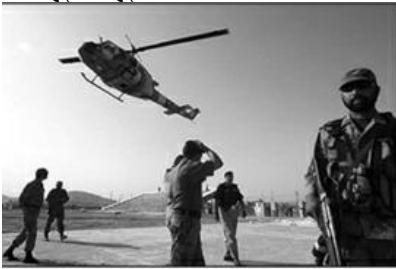
मिगोरा शहरातील संचारबंदी

स्वातमधील फझलुल्लानं सरकारला धमकी दिली होती. याचा परिणाम काही दिवसांत दिसू लागला. पाकिस्तानी सैन्य स्वातमध्ये पोहोचले. जीप गाड्या, रणगाडे आणि हेलिकॉप्टरच्या आवाजानं खुशाल पब्लिक स्कूलच्या मुलांना आनंद झाला. मलाला हेलिकॉप्टरकडे बघून विचार करू लागली. हे थांबलं पाहिजे; पण दोन्हीबाजूचे सैनिक हे ऐकत नाहीत. सैन्याच्या आगमनाबरोबर मिंगोरा शहरात संचारबंदी जाहीर झाली. हा अनुभव आतापर्यंत इथल्या माणसांना नव्हता. कर्फ्यूमुळं शाळा बंद झाल्या. घराबाहेर पडणं थांबलं. टी.व्ही. वर सैनिकी कारवायांच्या बातम्या येऊ लागल्या. मिंगोरा बाहेर आजूबाजूच्या डोंगरात लढाई सुरू झाली.