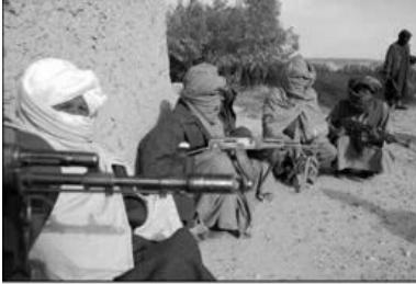
मिर्गोरा शहरातील तालिबानी

“कधी? मी शाळेत निघाले की, आजूबाजूचा प्रत्येक माणूस मला तालिबानी वाटू लागतो.”