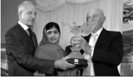
आंतरराष्ट्रीय शांतता पुरस्कार