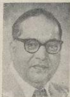
डॉ. यावासाहेब आंबेडकर