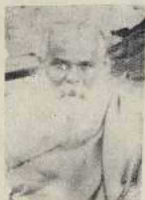
डॉ. महर्षि चिदंबरामजी शिंदे