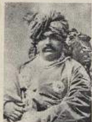
राजार्षि छत्रपती शाहू महाराज