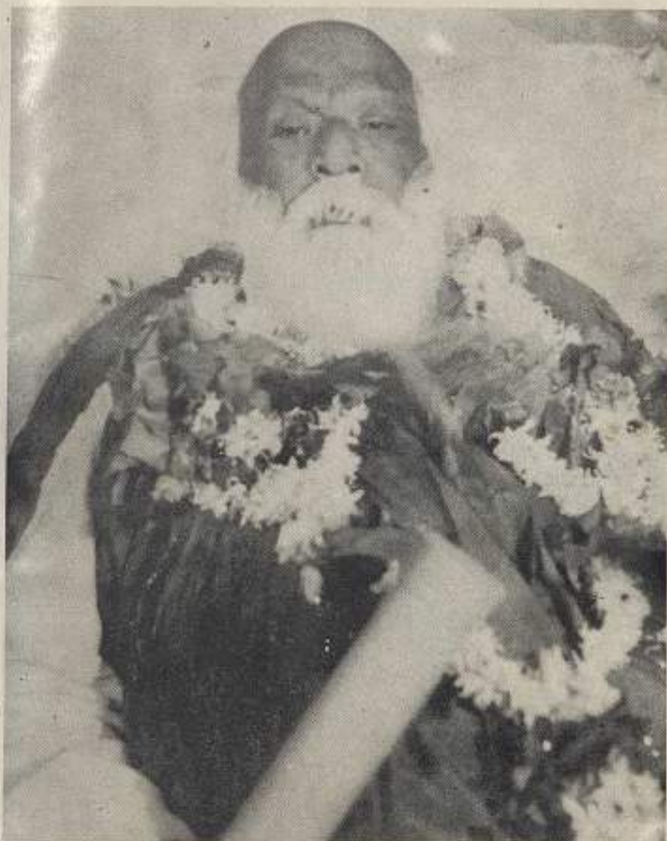
पुणे विद्यापीठाने कर्मवीर भाऊराव पाटील यांना (ते आजारी असल्याने ससून हॉस्पिटल, पुणे येथे) डी. लिट्. पदवी प्रदान केली. (५ एप्रिल १९५९).