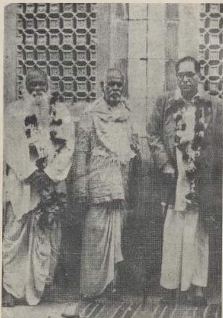
कर्मवीर भाऊराव पाटील, संत गाडगेमहाराज व डॉ. दादासाहेब अंबेडकर