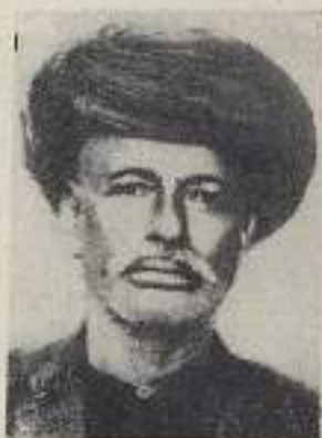
महात्मा जोतिराव फुले