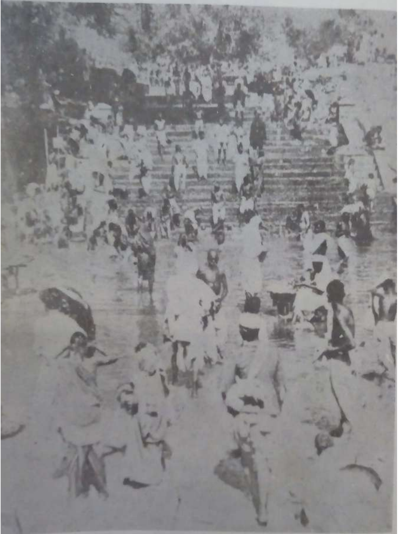
पूर्ण नदीवरील घाट गाडगंवाचा यांनी १९०८ साली बांधला