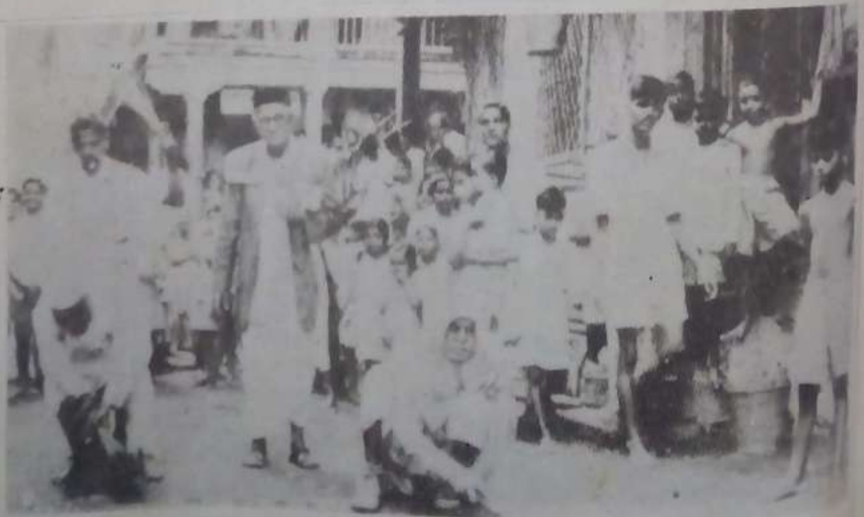
मुंबईच्या एका आडरस्त्याला सफाई मोहीम