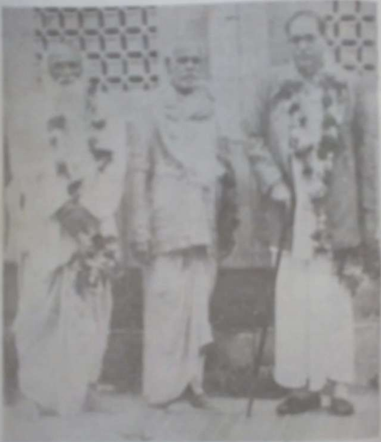
REVEREND MOTHER AND THE BROTHERS OF THE CONGREGATION AT THE HOUSE OF THE SACRAMENTS, MADRAS