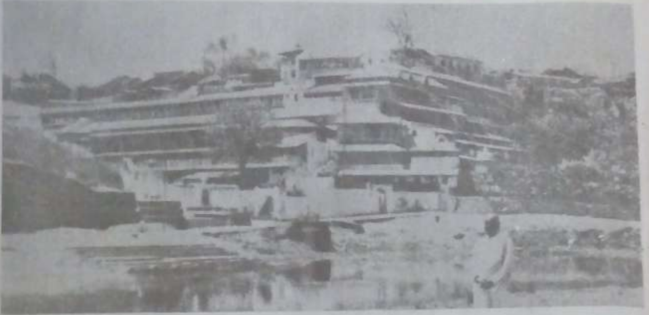
अनेक मजले असलेला नाशिक येथील धर्मशाळा ही १९३० साली उभ्या झाली.