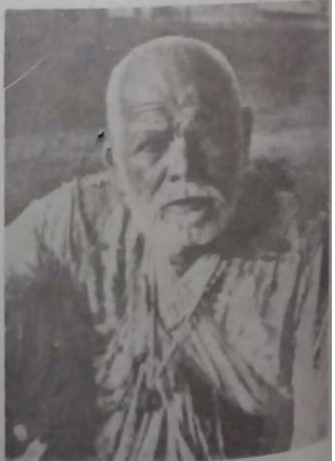
१९४२ साली त्यांच्या निधनाच्या वर्षी