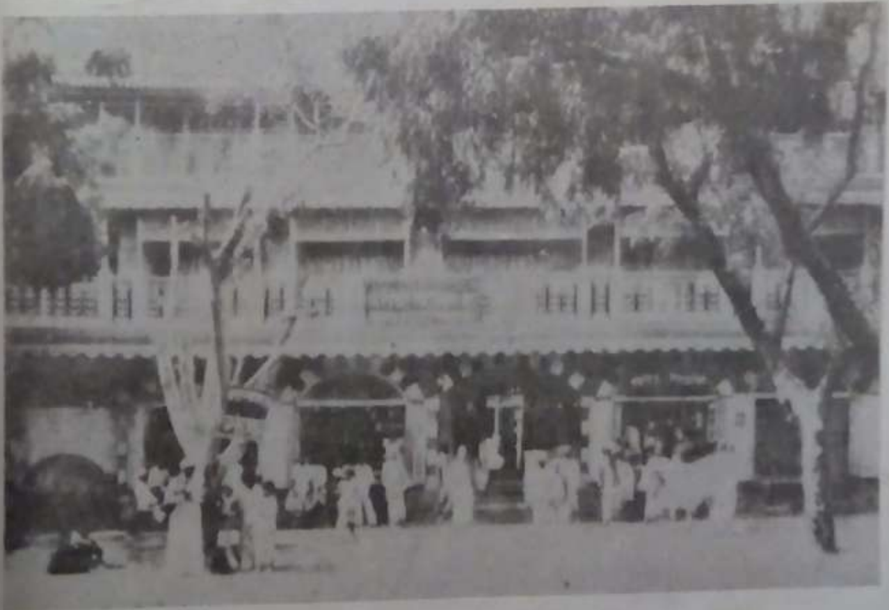
पंढरपूर येथील मराठा धर्मशाळा. ही १९३० साली बांधण्यात आली.