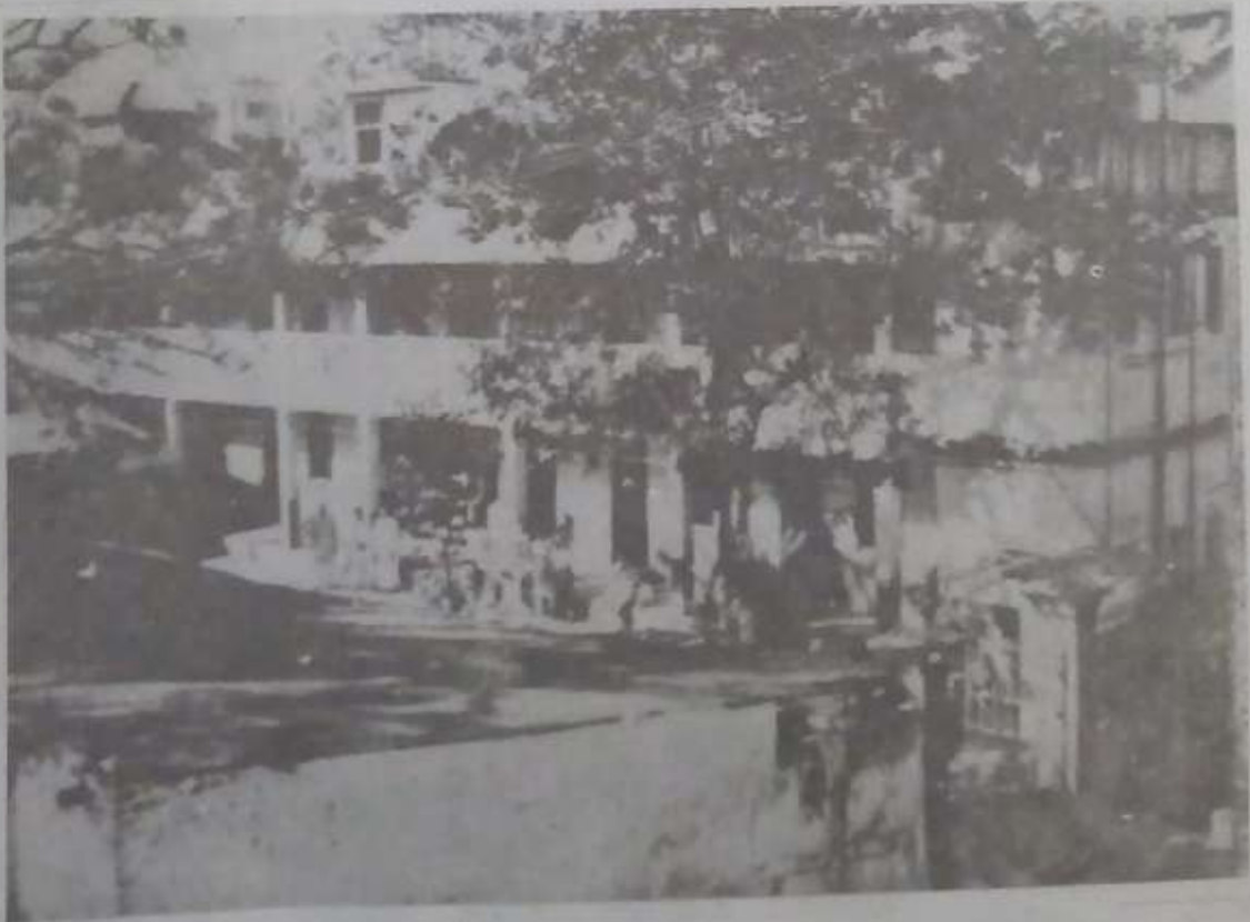
मुंबईच्या ज. ज. रुग्णालयाला लागून असलेली धर्मशाळा