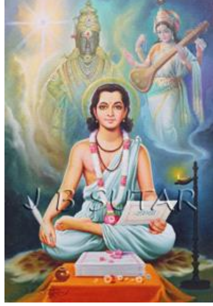
संत ज्ञानेश्वर महाराज

ह्या भागामध्ये सद्गुरुस्तवन व सद्गुरुकृपेवरचे अभंग आहेत, मानव जन्माचे मुख्य ध्येय काय ह्याचे विवरण पण आहे.